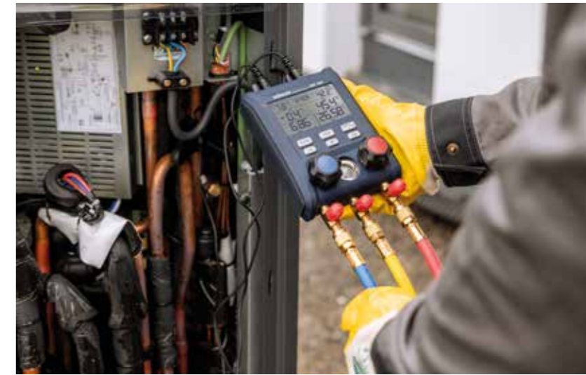
Großer Anwendungsbereich durch verschiedene Messoptionen.