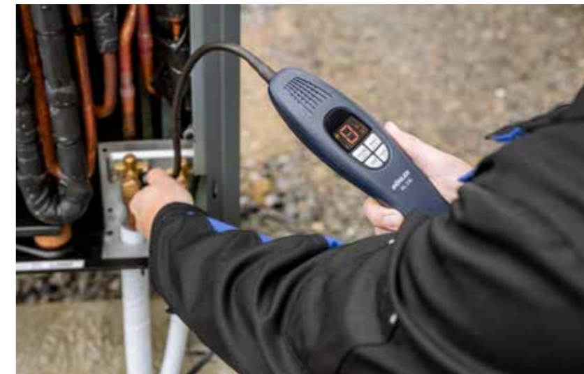
Präzise Detektion von allen gängigen Kältemitteln.