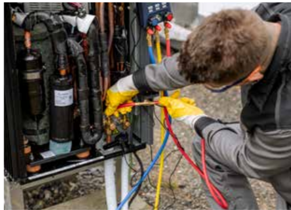
Einfache Durchführung von Wartungsarbeiten an Wärmepumpen