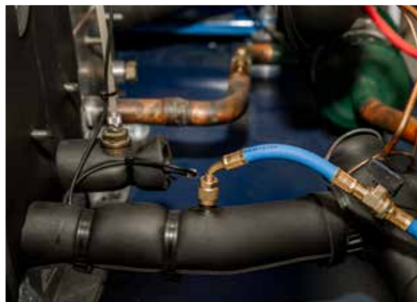
Anschlusschläuche mit Kugelhähnen zum schnellen Verschließen und Öffnen des Kältemittel-Durchflusses